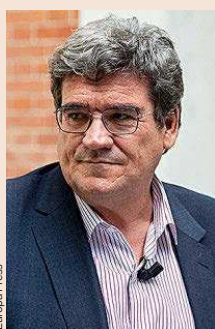
El ministro de Seguridad Social, José Luis Escrivá.

El IMV ha tenido desde marzo un aporte adicional del 15% y ahora las pensiones contributivas tendrán ese mismo incremento, que se incluirá en la prórroga del real decreto ley de respuesta a las consecuencias de la guerra en Ucrania. El ministro señaló que el Gobierno ya tenía esta decisión "en la cabeza" y aho-